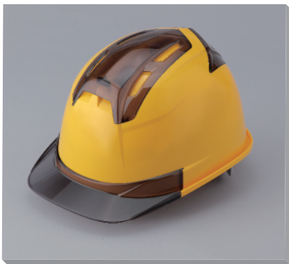
No.396F-S うす黄 ひさし：スモーク スチロールライナー入り ¥4,700 111795 梱包単位：10 個