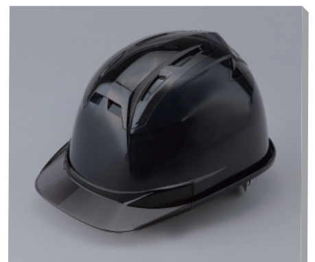
No.396F-S 紺 ひさし：スモーク スチロールライナー入り ¥4,700 111818 梱包単位：10 個