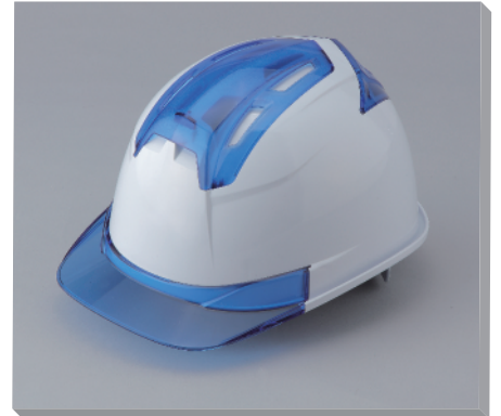
No.396F-Bu 白 ひさし：ブルー スチロールライナー入り ¥4,700 111788 梱包単位：10 個