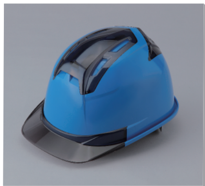
No.396F-S ロイヤルブルー ひさし：スモーク スチロールライナー入り ¥4,700 111801 梱包単位：10 個