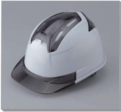
No.396F-S 白 ひさし：スモーク スチロールライナー入り ¥4,700 111764 梱包単位：10 個