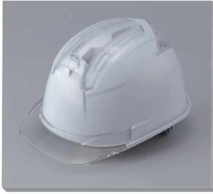
No.396F-C 白 ひさし：クリア スチロールライナー入り ¥4,700 111771 梱包単位：10 個